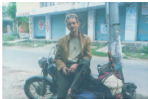
Selv om hans venner frarådede det, mellemlandede han i Moskva på vej tilbage til Indien efter sit fængselsophold.